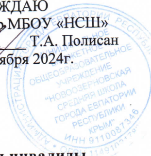
График питания учащихся 1-4, 5-11 классов, детей-сирот, детей, лишенных родительской опеки, дети инвалиды, дети с ОВЗ, СВО, детей из многодетных и малоимущих семей на 2024-2025 учебного года